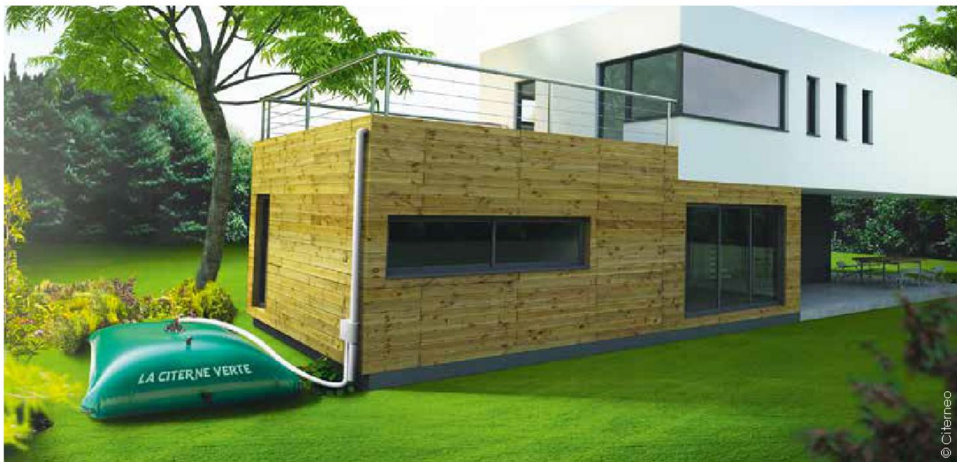
Les cuves proposées par Citerneo sont souples et se posent hors-sol. Très faciles à installer, elles trouvent leur place dans le jardin ou sous une terrasse par exemple.

L'eau est une denrée précieuse. Or, un mètre carré de toiture reçoit entre 800 et 1 100 litres tout au long de l'année. Un volume important qui peut être collecté pour préserver la ressource collective et permettre d'économiser l'eau potable, en utilisant l'eau de pluie pour les usages techniques.