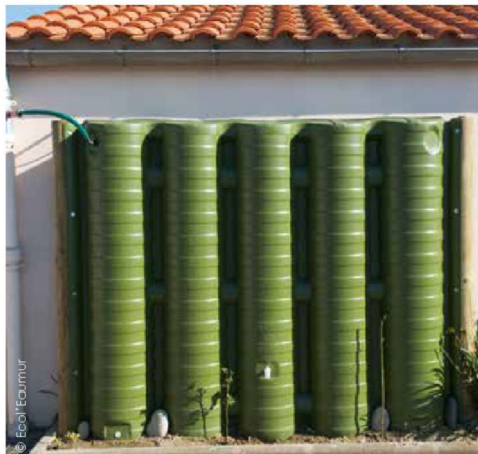
Ecol'Eaumur a mis au point un système de récupération verticale qui peut être adossé à un mur ou faire office de clôture, en étant bardé de bois par exemple. Un dispositif astucieux et simple à mettre en œuvre.

à bien la centrer et s'assurer qu'elle soit de niveau. Ce dernier point est primordial. Ce volume de stockage doit être associé à un système de filtration de grande capacité. L'étape suivante consiste à remblayer le trou latéralement de manière symétrique avec un sable stabilisé au compacteur : la cuve ne sera remplie qu'à l'issue de ce compactage. Il reste à raccorder la cuve avant de remblayer la dernière couche avec de la terre végétale débarrassée de tout cailloux. Attention : aucun véhicule ne devra circuler au-dessus de la cuve.